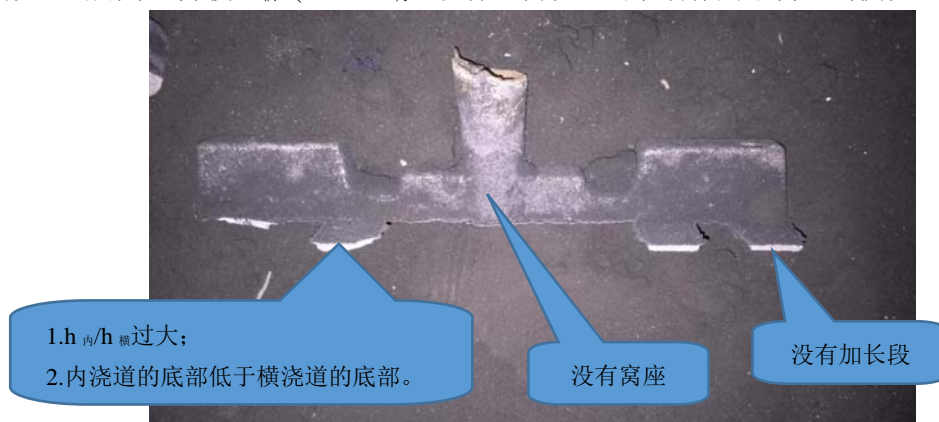
图 4 结构不合理的浇注系统

(5) 内浇道与横浇道高度比大。如图 4 所示，第一个内浇道设在阻流片下面， h_{\text{内}}/h_{\text{横}} 过大。在在内浇道附近除有继续向前流动的速度外，还有一个向内浇道流动的速度，因此，内浇道会将铁水“吸”进去。这种现象称为“吸动作用”。吸动作用区的范围通常都大于内浇道的断面积，杂质流经这个区域时就有被吸入内浇道而进入型腔的可能。吸动作用区范围的大小与内浇道中铁水流速成正比（当横浇道充满时，其流速决定于由浇口杯液面到横浇道的整个液柱高度），还随着内浇道断面的增大及内浇道、横浇道的高度比值 h_{\text{内}}/h_{\text{横}} 的增大而加大。当内浇道的断面积和 h_{\text{内}}/h_{\text{横}} 均较大时，吸动区可达横浇道顶部，上升到顶面的杂质也会被吸入型腔。反之，内浇道的断面积和 h_{\text{内}}/h_{\text{横}} 都不大时，横浇道的挡渣作用也较好。改进的措施是：将横浇道的断面做成高梯形，内浇道制成扁平梯形，内浇道在横浇道的底部，并使 h_{\text{横}}=(5\sim6)h_{\text{内}} ，以保证内浇道的吸动作用不会达到横浇道的顶部 [2] 。