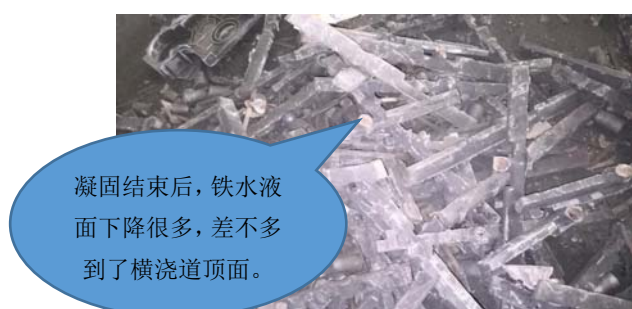
图 1 摆地摊造型的浇注系统

某发动机厂有的外协铸件的硬度低,达不到 HT250 的要求,供应商请主机厂铸造车间的工程师现场指导。试验结果大失所望,硬度是合格了,但没有一个成品,全部因缩孔缺陷报废。经对比发现,原来浇注系统有很大的差别,见图 1 和图 2。