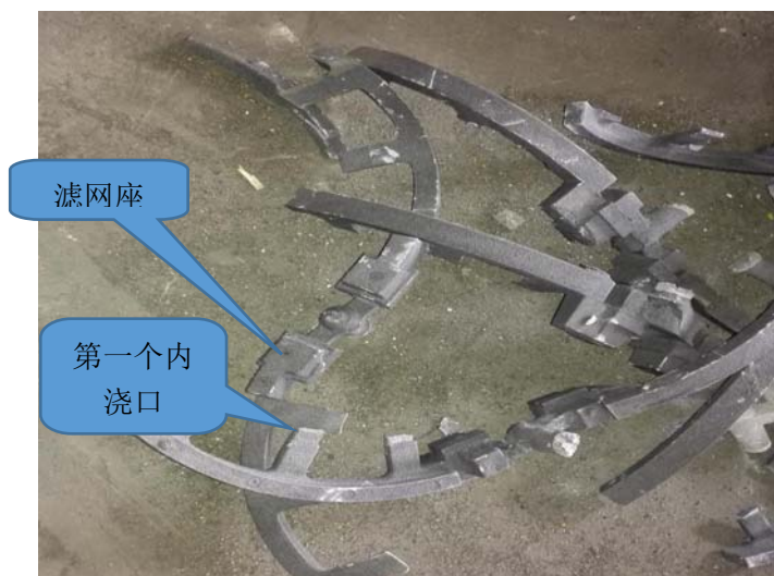
图 3 第一个内浇道与直浇道太近

铁水平稳而均匀地分配给各个内浇道；同时还起到捕集、保留由浇包经直浇道流入的夹杂物，故又称“捕渣器”或撇渣道，它是浇注系统中最后一道挡渣关口 [2] 。